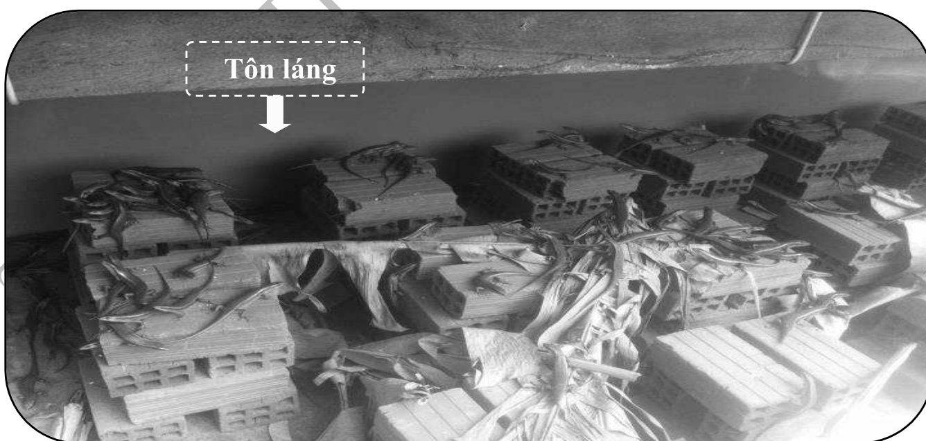
( Ảnh minh họa )

Cách xây chuồng rẻ nhất và tiết kiệm nhất là phương pháp vây tôn lóng. Có nhiều cách làm khi vây tôn: cách 1 “ xây từ đất lên khoảng 3 viên gạch trên đầu gạch ta để chân tôn lên và trám xi măng, chiều cao tôn khoảng 1 mét, xung quanh chuồng đóng cây để giữ tôn ”; cách 2 “ chôn tôn xuống đất và dùng cây để cố định chuồng, chiều cao tôn trên mặt đất khoảng 1,2 mét, độ sâu tôn chôn dưới đất khoảng 25cm ”. Phương pháp này ít tốn kém, tuổi thọ 2,5 năm.