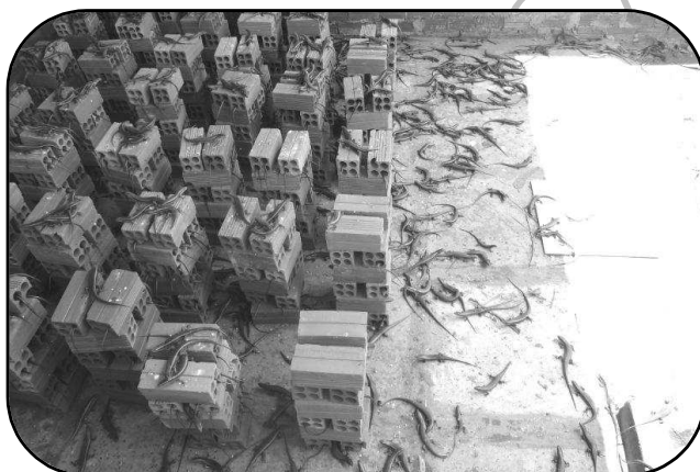
( Ảnh minh họa )

Cách xây chuồng rẻ nhất và tiết kiệm nhất là phương pháp vây tôn lóng. Có nhiều cách làm khi vây tôn: cách 1 “ xây từ đất lên khoảng 3 viên gạch trên đầu gạch ta để chân tôn lên và trám xi măng, chiều cao tôn khoảng 1 mét, xung quanh chuồng đóng cây để giữ tôn ”; cách 2 “ chôn tôn xuống đất và dùng cây để cố định chuồng, chiều cao tôn trên mặt đất khoảng 1,2 mét, độ sâu tôn chôn dưới đất khoảng 25cm ”. Phương pháp này ít tốn kém, tuổi thọ 2,5 năm.